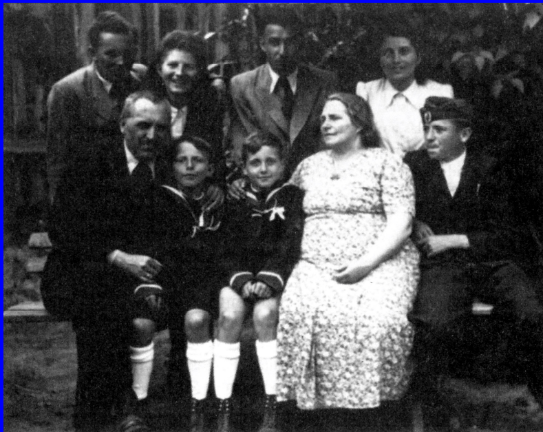
Nagyszüleivel és nagybátyaival elsőáldozás után

Középiskolai tanulmányait a nagykanizsai piarista, majd a keszthelyi premontrei gimnáziumban végezte, ahol 1951-ben érettségizett.