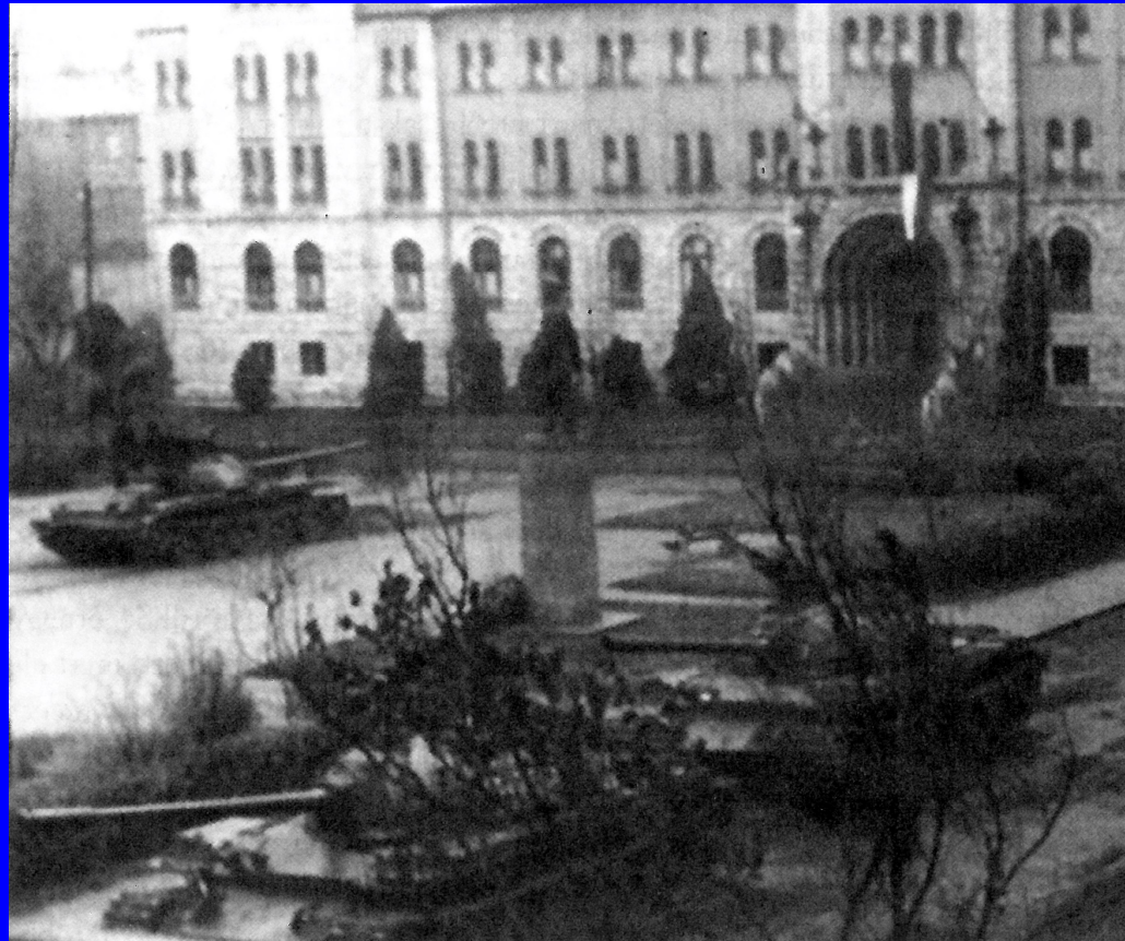
A Mór Kollégium bejáratára irányított harckocsi löveg elérte a fegyvereiket

1956-ban megválasztják a Nemzetőr Zászlóalj vezetőjévé a Pécsi Egyetemen, mely miatt 1957-ben a forradalom leverése után több hadbírósnági tárgyalást követően megfosztják egyetemi gyakornoki állásától, eltiltják az oktatástól