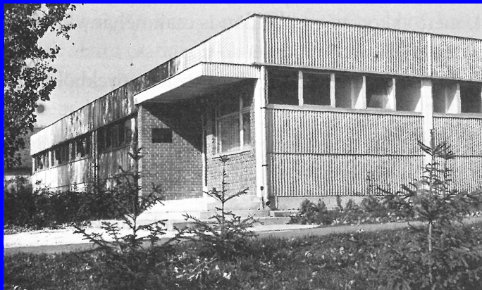
A Kaposvári Megyei Kórház és a Mezőgazdasági Főiskola közös használatára épített kísérleti állatház.

Hosszú, eredményekben gazdag szakmai pályafutása során számos megbetegedés kezelésének eredményesebbé tétele, valamint új sebészi eljárások kidolgozása, meghonosítása fűződik a nevéhez hazai és nemzetközi területen is.