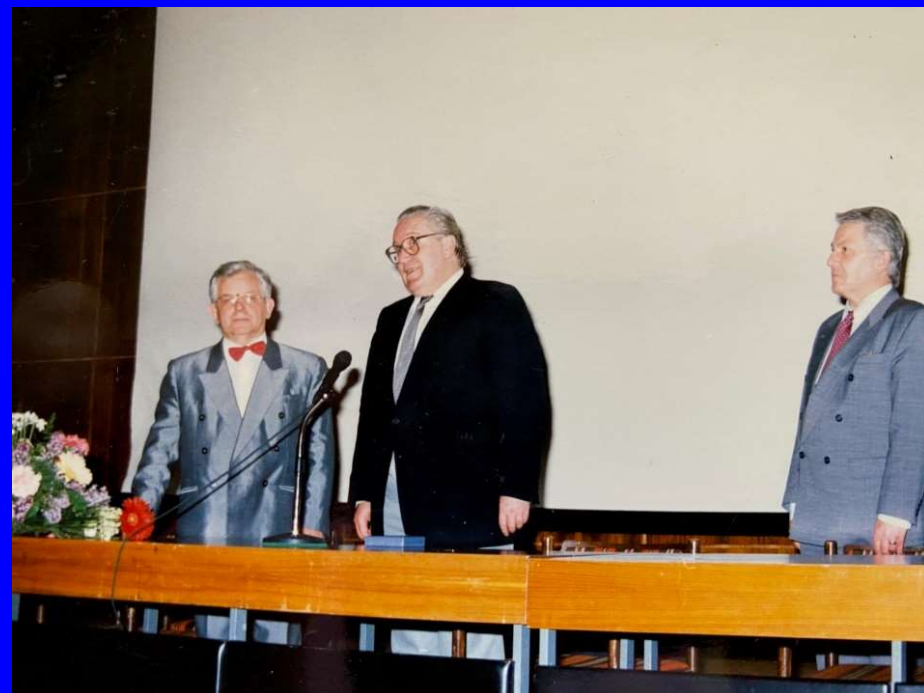
Innovációs Különdíj 1995. (MTA és Magyar Állam)