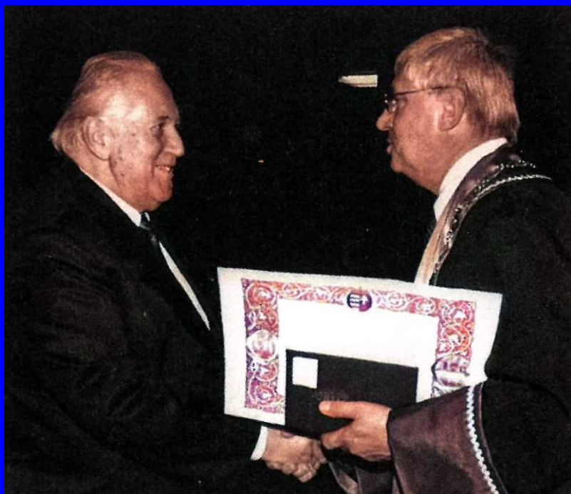
Balassa Emlékérem 1995.