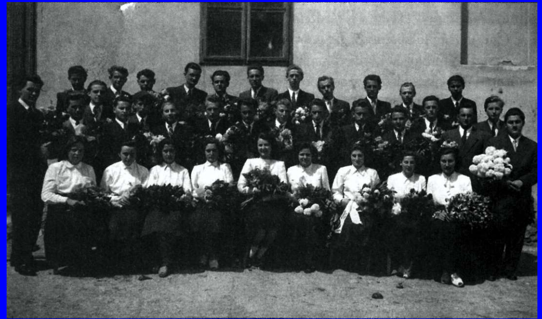
Ballagás után (felső sorban jobbról a hatodik)